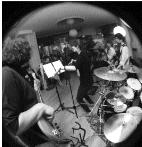
A Funkorporation még keresi a saját hangját

A két nyertes együttest a Médiabefutó hivatalos honlapján (mediabefuto.ro) meg lehet hallgatni, május 29-e déli 12 óráig pedig szavazhatnak a legjobbra, aki elnyeri majd a Médiabefutó közönségdíját.